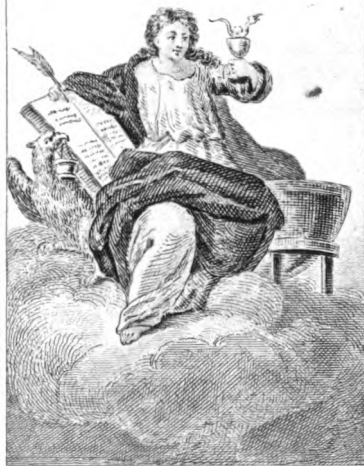
SAN JUAN EVANGELISTA

Padeció debajo del poder de Poncio Pilato fue crucificado, muerto, y sepultado.